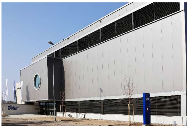
▲欧州ソリューションセンター外観